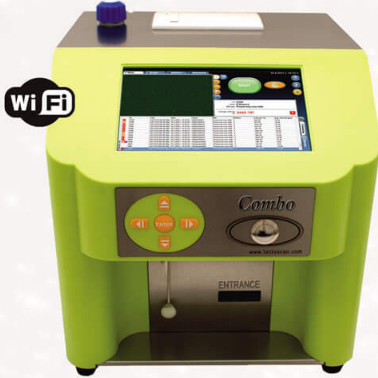
مدل لاکتواسکن کمبو

سرّیع، دقیق، قابل اعتماد کنترل کامل کیفیت شیر